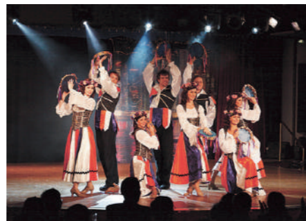
【船内各種イベント】 ※ショーの一例 出港セレモニー(ドリンクを片手にセイルアウエーパーティ)/映画上映/フィットネスセンター/アスカ アヴェダ サロン&スパ(有料)/ピアノタイム/飛鳥IIプロダクションショー/ティータイム/ミュージックタイム/夕食後は「アスカバル」でおつまみやデザート/各種カルチャー教室など

【オプションツアー共通のご案内】 ●オプションツアー実施日/2024年8月26日(月) ●旅行代金/各コースにて旅行代金を設定(表中参照) ●添乗員/同行(一部コースは除く) ●スケジュールは予定時刻になります。天候、道路状況により変更になる場合があります。