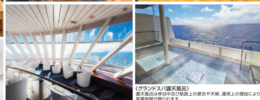
(グラندスバ露天風呂) 露天風呂は停泊中及び航路上の都合や天候、運用上の理由により営業時間が限られます。