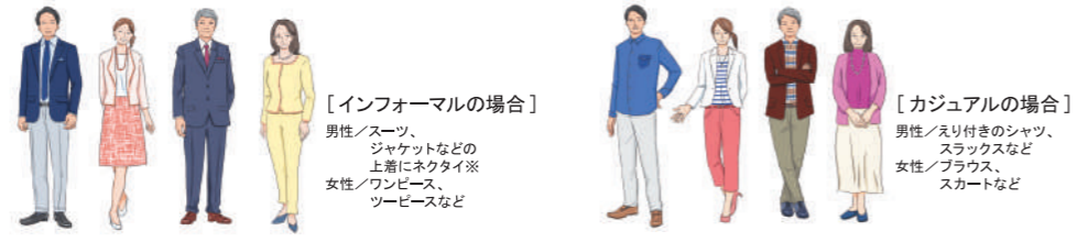
※インフォーマルでの男性のネクタイ(アスコットタイ、ループタイ含む)着用については各自お任せになります。

●ドレスコードとは お客様一人一人が、その夜にふさわしいおしゃれで船内の雰囲気を楽しめるという目的で、ドレスコード(服装指定)が設けられています。船内新聞「アスカデイリー」でご案内するドレスコードでお過ごしください。