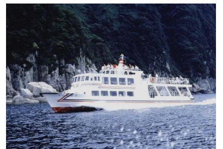
蘇洞門めぐり遊覧船

「蘇洞門」は小浜湾東側に位置する内外海半島北側の海岸にある海蝕洞で、花崗岩が日本海の波の作用で削られてできたものです。豪壮な景観は若狭湾国定公園を代表する景勝地となっており、昭和9年に国の名勝に指定されています。