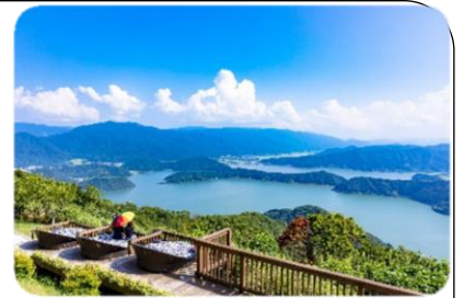
三方五湖レインボーライン 天空のテラス

レインボーライン山頂公園に「味方五湖に浮かぶ天空のテラス」をコンセプトに、おしゃれなテラスが5カ所あります。歩きながら360度の大自然が楽しめる日本国内の景勝地にはない圧倒的な魅力の山頂公園。美浜テラスには足湯があり、タオルが別途必要になります。