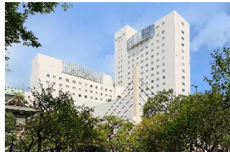
ホテルフジタ福井 外観