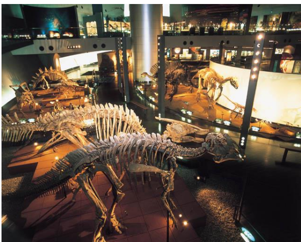
福井県立恐竜博物館 イメージ