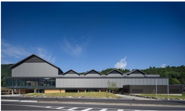
一乗谷朝倉氏遺跡博物館 イメージ