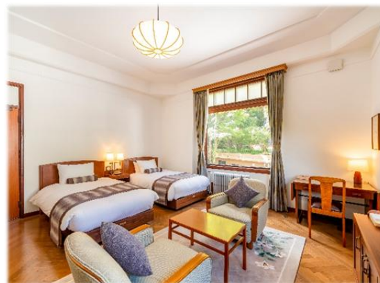
富士屋ホテル 花御殿 客室(イメージ)