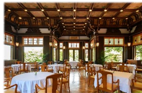
メインダイニングルーム・ザ・フジヤ(イメージ)