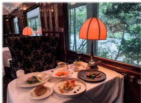
2日目 オリент急行車内でランチ

フランスの宝飾・ガラス工芸作家「ルネ・ラリック」の生涯にわたる作品が展示されている美術館で、大胆さと繊細さを兼ね備えたジュエリーとガラス作品が展示されています。見どころは、ルネ・ラリックが内装を手掛けた「オリент急行」です。1929年にパリと南フランスを結ぶ「コート・ダジュール特急」として使用された実物の車両が展示されています。オリент急行車内で特別なランチをお楽しみください。