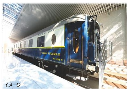
オリент急行(イメージ)