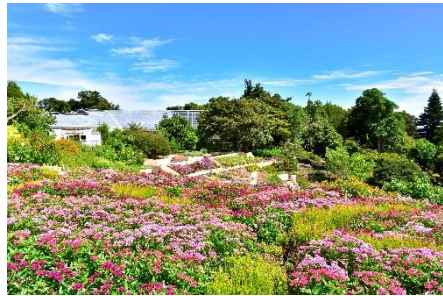
フラワーガーデン(※イメージ 季節・気候によって変動します)