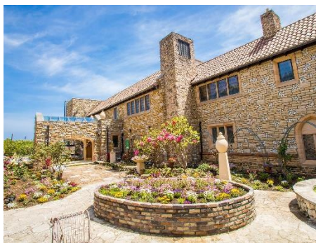
川奈ステンドグラス美術館 外観(イメージ)