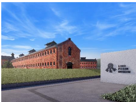
ミュージアムゲート イメージ