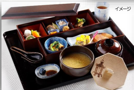
朝食(茶粥)イメージ