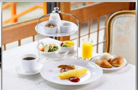
朝食(洋風)イメージ