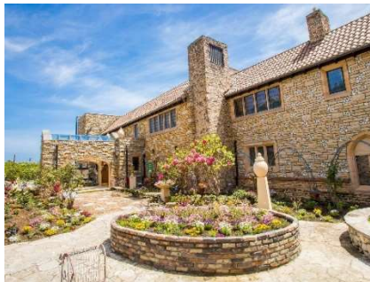
川奈スタンドグラス美術館 外観 (イメージ)

川奈スタンドグラス美術館は、英国から譲り受けた伝統ある1800年代中心のスタンドグラスが至る所に配されています。英国教会で多くのスタンドグラスを手がけたチャールズ・ケンプ、童話挿絵でも有名なハリー・クラークのガラス職人時代の作品など、どれも実際に英国の教会や聖堂、貴族の貴賓室やプライベートルームを飾っていた本物のアンティークスタンドグラスです。スタンドグラスやランプの柔らかな光があふれる幻想的な館内は、アンティークオルゴールやアンティークパイプオルガンの音色、アロマの香りが満ちた癒しの空間をお楽しみいただけます。