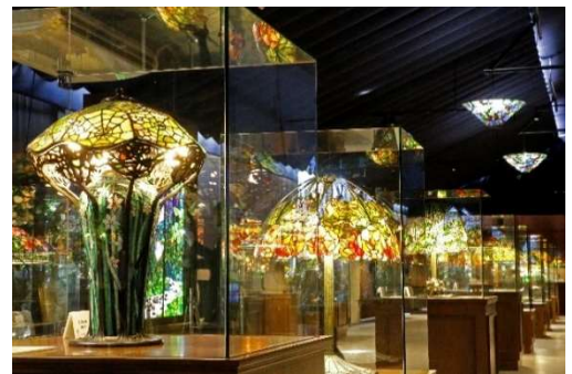
ティファニーランプが煌めく展示室 (イメージ)