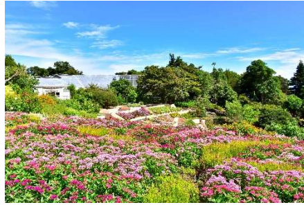
フラワーガーデン (※イメージ 季節・気候によって変動します)