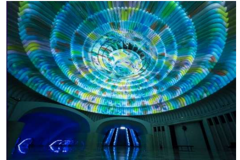
円形ホール (イメージ)

相模灘を望む高台に建つ MOA 美術館 四季の花が咲く日本庭園と、光の万華鏡が滲う 幻想の世界、自然と美がひとつになる場で 日常の少し先にある豊かさを感じることができます